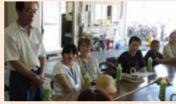
Do No.64 沖島で沖島を語ろう