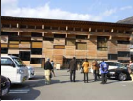
Do No.63 高知県橋原(ゆずはら)町