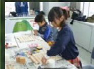
「親子木工体験教室」開催 木の時間割表作り