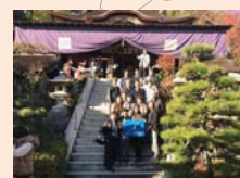
Do No.80 国宝宝厳寺「唐門」等保存修理工事見学