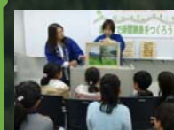
木の国わかやま 木育キャラバン in 田辺市