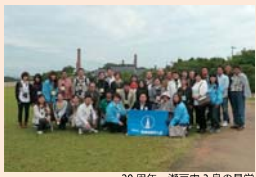
20周年 瀬戸内3島の見学

Do シリーズとは、滋賀県建築士会女性委員会が主催する会員、非会員、一般の方を対象にした講習会です。