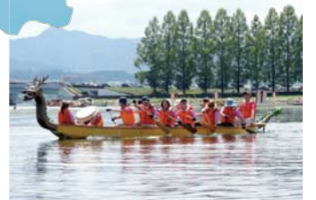
びわこペーロン 2009～2018年 両振りしました！