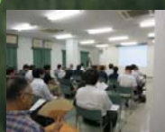
セミナー開催 「木材乾燥の違い、木工法等について木の家づくりのスペシャリストに聴く」