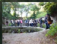
見学会開催 「和歌山市加太周辺と友ヶ島」