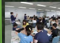
「親子木工体験教室」開催 木の時間割表作り