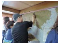
Do No.71 左官ワークショップ