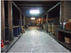
Do No.62 伝統ある酒蔵を訪ねて