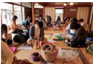
Do No.79 座面編みに集中