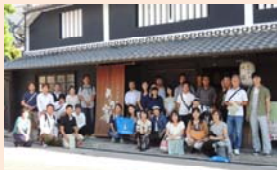
Do No.74 中山道守山宿