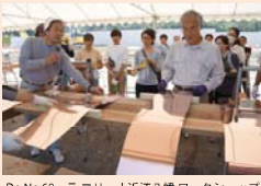
Do No.68 ラ コリーナ近江八幡 ワークショップ