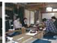
昼食交流会の様子