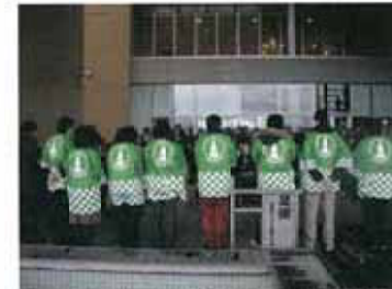
閉会式にて、青年と一緒に本年度後期ブロックを岐阜県高山市で開催のPRをする。