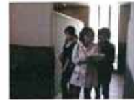
士会の男性委員と一緒に調査