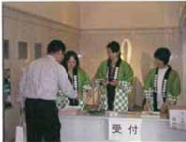
受付を女性委員が担当