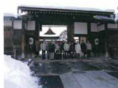
陣屋前で集合写真