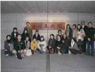
美術館玄関前にて集合写真