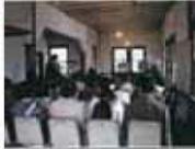
近江編郵便局にて説明を受ける