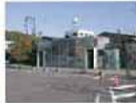
各務原駅の公共トイレ