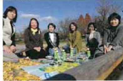
学びの森にて見学会