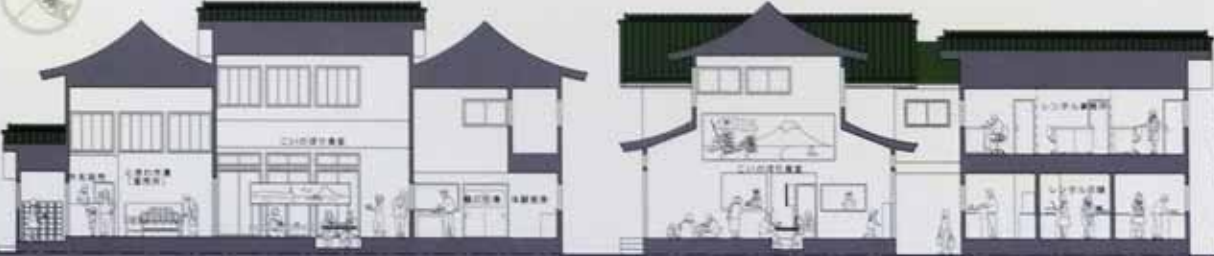
A-A 断面図 1/100