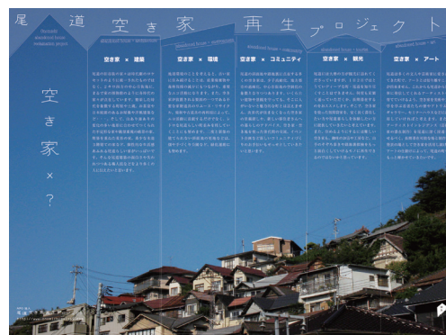
尾道空き家再生プロジェクト