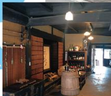
中川醤油醸造場店内