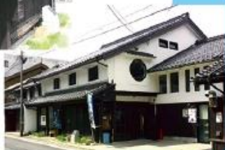
町屋づくりの建物