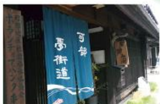
NPO法人クインズ可部 可部夢街道コミュニティサロン 「可笑風」