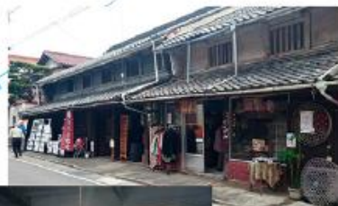
中川醤油醸造場 イベント風景

可部地区の地域資源である 古民家および町屋の新たな価値、 新たな用途が見出せるよう 地域でサポートします。