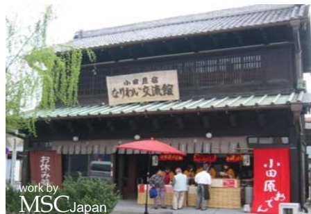
小田原宿なりわい交流館