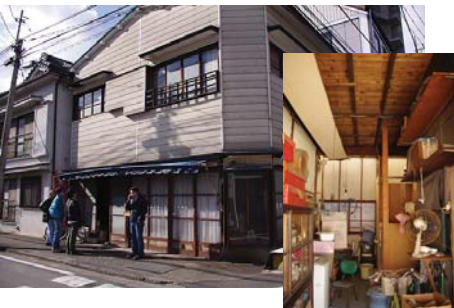
元染物店(10年間無人)