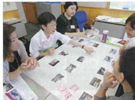
E分科会ワークショップ風景

後半は「関門地区景観ウォッチング&セミナー」の今年度のテーマである「屋外広告物」についてのワークショップを行った。屋外広告物のある景観写真を見て、「好き、嫌い」「圧迫感がある、開放感がある」などのいくつかの指標で評価し、チェックシートに記入後、グループでそれぞれの景観写真について、どこがそう感じるのか、なぜそう感じるのか、など意見を出し合った。「広告の形と色が整っていないのが気になる。少しの配慮で整ったものになるのではないか」「広告物をコントロールしたいとい