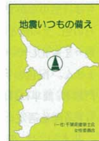
独自の防災リーフレット『地震いつもの備え』