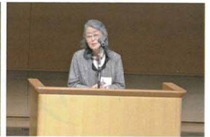
写真3 村松泰子理事長((公財)日本女性学習財団)による来賓挨拶