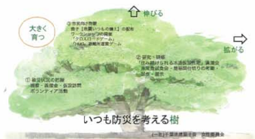
3本柱の活動イメージ「いつも防災を考える樹」