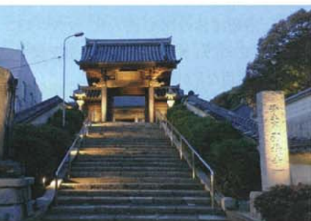
業務委託を受けた引接寺ライトアップ社会実験

左…「関門地区景観ウォッチング&セミナー」でのまちあるき 右…平成25年度 都市景観大賞の景観教育・普及啓発部門で大賞を受賞。2県にまたがった地域の活動は前例のない受賞となった