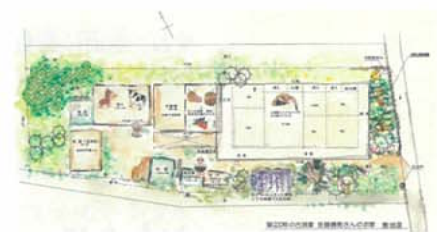
「記憶の中の住まい」プロジェクトでは聞き取り成果として間取り図を描き起こした