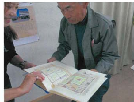
聞き取った住まいをスケッチで描き起こし、成果品をご本人へ贈呈