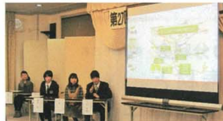
「信州環境ECOコンテスト」の2次審査は公開プレゼン。学生は「青年・建築士の集い」で発表する

高校生へのアンケートでは、30%が「建築士になりたい」、50%が「どちらかと言えばなりた