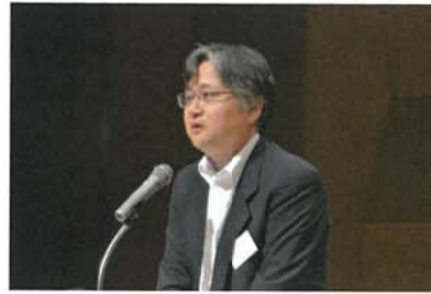
写真2 石崎和志課長(国土交通省住宅局建築指導課)による来賓挨拶