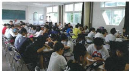
授業時間を使い、5~6名の生徒に対し建築士1名がついてグループディスカッション

その後、「自分たちの地域を知ろう」という目的で学生に行った授業で使用したワークシ