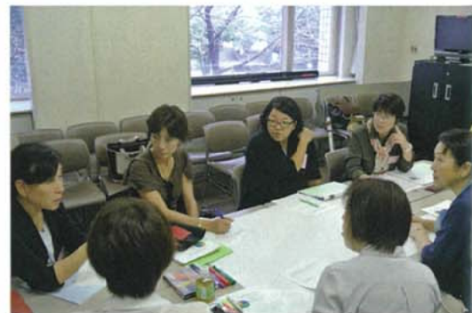
F分科会ワークショップ風景