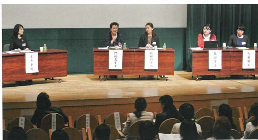
写真3 パネルディスカッション風景

商店街での取り組みの一つをご紹介しますと、女性建築士がリーダーとなり、車椅子に乗ってみんなで買い物しようという企画を行いました。普段、商店街には車椅子の人はまったく見かけません。お店はバリアフリーで設計されているけれども、実際はどうなのか。この企画をやってみて、目から鱗が落ちるほどの気づきがありました。それは何かと言いますと、結局、段差の問題よりも、みんなが声をかけて助け合い、相手を