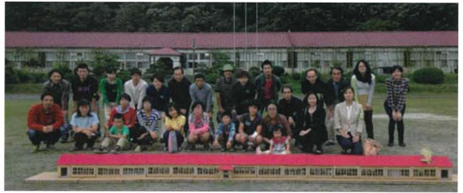
なかなか大学校「模型教室」

発表事例は、昭和26(1951)年に建てられた長さ119mの木造平屋建ての小学校(遠古袋小学校)にまつわる活動である。国内でも有数のその長い校舎は、半分を改修し、残りは解体すると決定されていたが、全体を残すことに