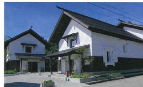
金山杉を活用した金山町の「金山型住宅」