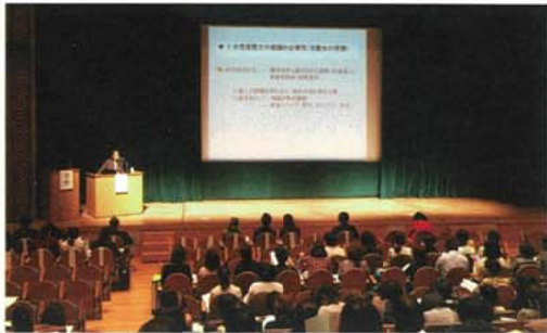
写真1 基調講演風景