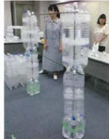
研究・研修活動「ペットボトルを利用した簡易つい立」の制作