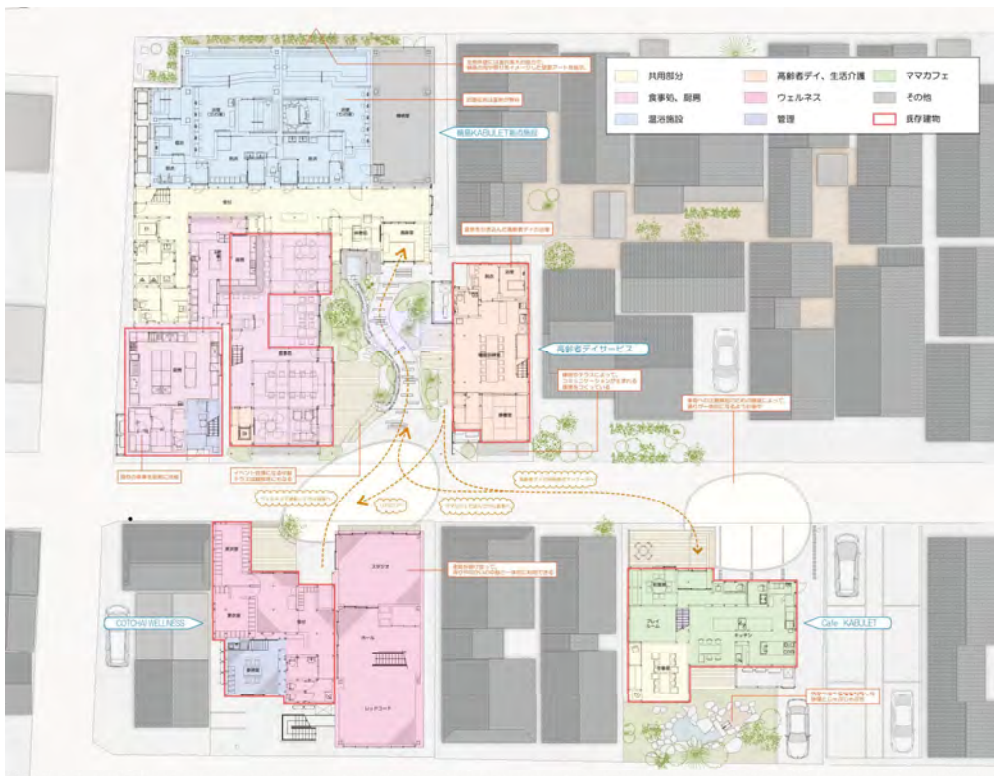
配置図兼1階平面図