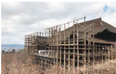
保存修理工事中の清水寺

また、観光地のほど近くにある六原地区の地域住民主体で進められているまちなかの空き家対策と防災まちづくりの取り組みについて理解を深めます。観光名所とその界隈のいまの職住環境を知るコンパクトなコースです。