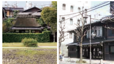
山紫水明処 (鴨川東岸より)