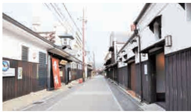
酒処伏見のまちなみ

また、「伏水」と呼ばれる良い水に恵まれた日本酒の産地で酒蔵の日本酒を楽しみます。