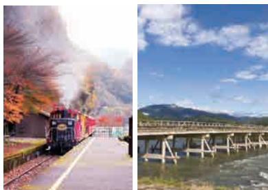
嵯峨野トロッコ列車