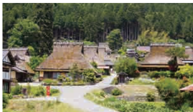
美山かやぶきの里

亀岡から嵐山までの7.3kmを結ぶ嵯峨野トロッコ列車で、自然豊かなロケーションを眺めつつ列車旅を満喫、嵐山では渡月橋や竹林の散策をしていただきます。