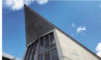
カトリック桂教会