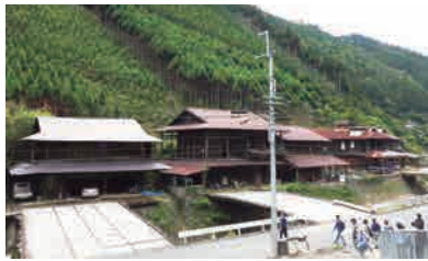
中川地区の木造倉庫群

また、日蓮宗京都八本山の一つである立本寺では、高僧の手ほどきをうけ写仏を体験、世界遺産仁和寺見学、真言宗御室派の別格本山蓮華寺で御室太鼓鑑賞、旅の締めくりに車中で北山の里名物の「草もち」をいただきます。