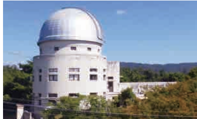
京都大学花山天文台